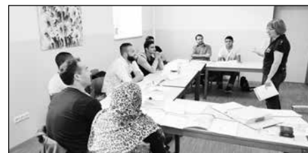
Deutsch-Unterricht im "Komm rein"