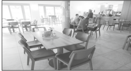
Gemütliche Atmosphäre im Begegnungscafé

werden - Ellen Prasch kauft Fleisch, Kartoffeln und Gemüse frisch ein und verarbeitet es in der Küche des Begegnungscafés zu schmackhaften Gerichten.