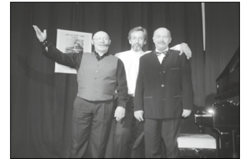
Hintersinnige Lieder von Georg Kreisler - zu hören im September im Begegnungscafé