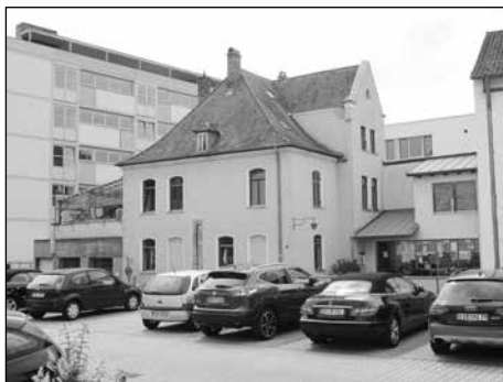
Das Pfarramt in der Pestalozzi-Strasse

Nun haben wir seitens der Landeskirche positive Signale bekommen: Wir dürfen weiterplanen! Die Chancen stehen gut, dass das Projekt mit einer großzügigen Unterstützung durch die Landeskirche und die AG "Herberge"