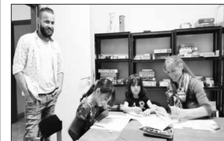
Kinderbetreuung während der Sprachkurse

Interkultureller Spieleabend wie auch In- terkulturelles Kochen sind gedacht für Menschen aller Nationen und jeden Alters. Herzliche Einladung!